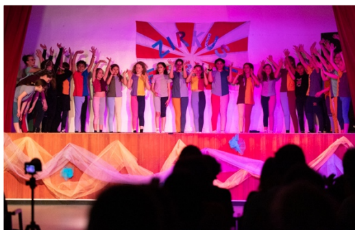
Zirkusprojekt der 2. Kreativklasse

Die kreativen Schöpfungen können bei der Adventfeier, beim KulturCafé oder auch beim Schulfest im Juni bewundert werden. Online Dokumentation unter https://www.grg17geblergasse.at/schulblog/