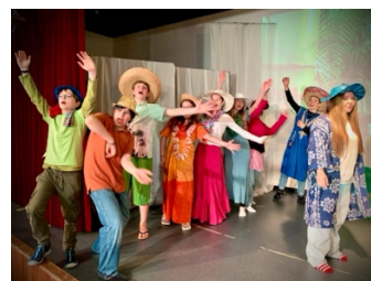
Uncle Bill's Will English Theater der 3. Klasse