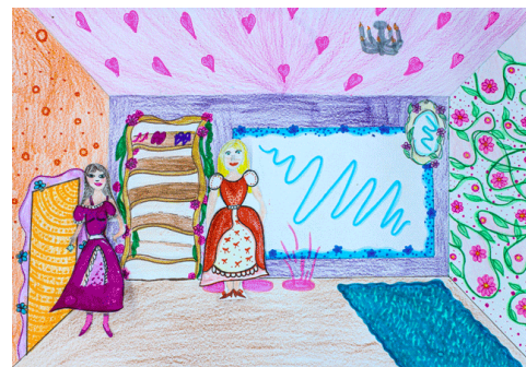
Stop Motion Animation der 2 Klasse