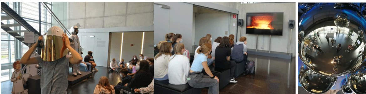
Ausflug zur Voest Alpine nach Linz

In der 8. Klasse besuchst du den Maturatag in unserer Schule, wo du Informationen für deinen weiteren Bildungsweg bekommst.