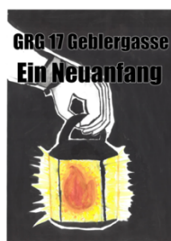
„Musik schreiben und produzieren“ der 1 Klasse https://www.artistcamp.com/SmartLinks/912003393752/