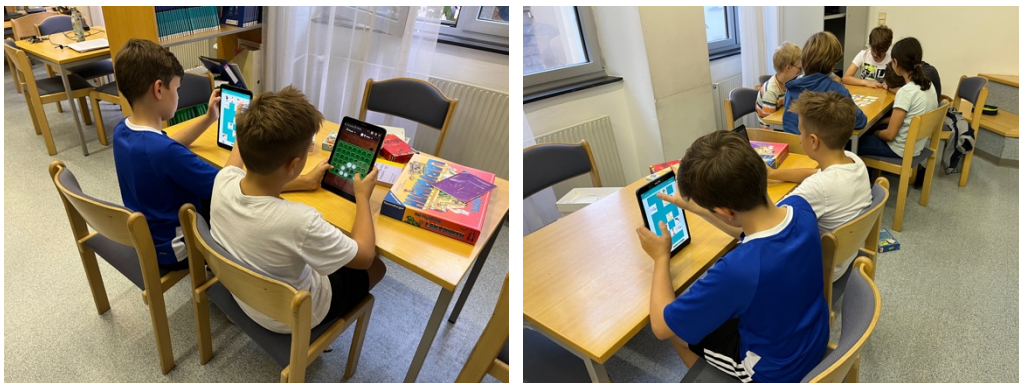
Methodenvielfalt auch in der Legastheniebetreuung mit Tablets und Lernsoftware bereitgestellt vom Absolvent:innenverein GRG17

Die Anmeldung für einen Legastheniekurs erfolgt zu Beginn des Schuljahres über den Klassenvorstand. Die Stunde findet normalerweise am Nachmittag in der Schule statt, dauert 50 Minuten und ist kostenlos. Die Kurse in der Schule sind kostenlos.