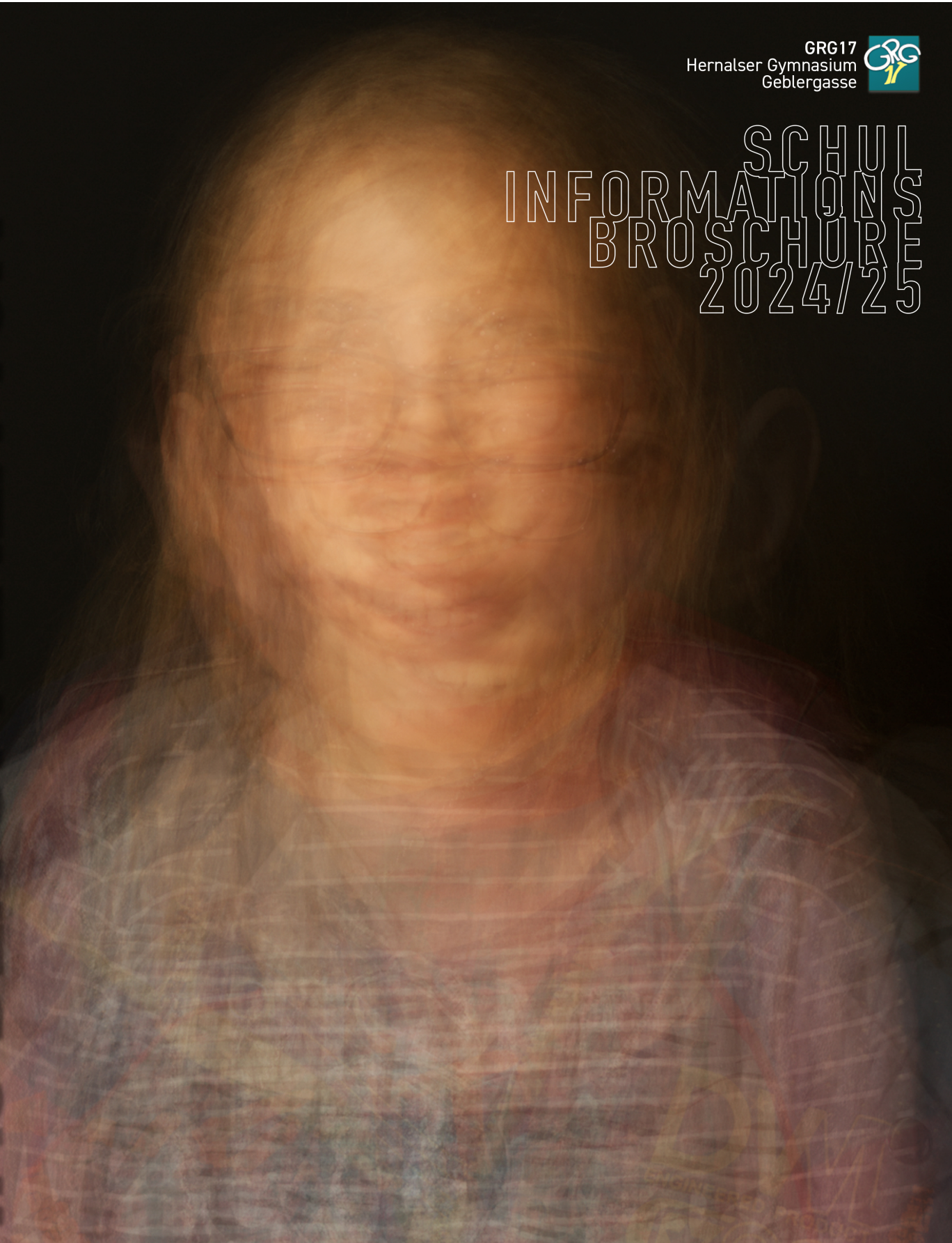
Videostill aus dem Kreativprojekt 'Blickwinkel' der Kreativklasse